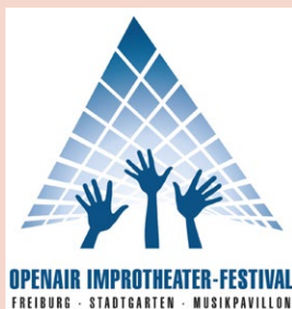
Foto: Theatersport in Freiburg.

12 Veranstaltungen von elf Impro-Gruppen an sechs Tagen – von Anfänger:innen über Fortgeschrittene bis zu Profis sind beim Festival alle Levels vertreten. Bereits zum 24. Mal wird die Theatergruppe FREISTIL beim Festival dabei sein. Bei diesem Höhepunkt des Freiburger Improjah-